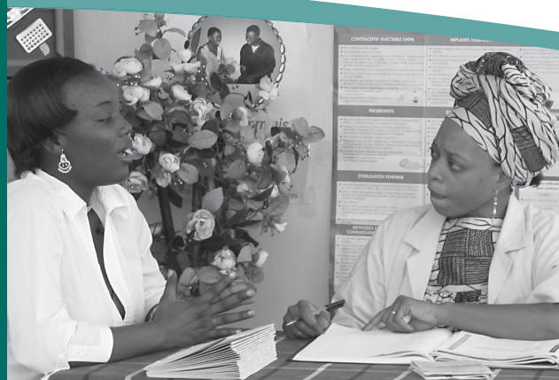
Seule critère médicale pour l'utilisation de la MJF : des cycles qui durent entre 26 et 32 jours.

Les perles de couleur de ce collier aident les femmes à utiliser la méthode et à suivre leurs cycles. Si elles ont leurs règles avant de déplacer l'anneau sur la