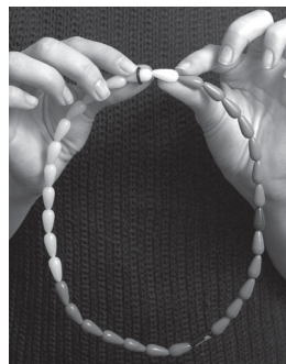
Collar del Ciclo, una ayuda visual que facilita el uso del Método de Días Fijos.

El Instituto de Salud Reproductiva desarrolló el Método de Días Fijos utilizando una metodología científica rigurosa. El método está basado en evidencia biológica de que cada mujer tiene en su ciclo menstrual una fase fértil durante la cual puede quedar embarazada que abarca los cinco días