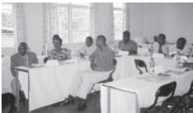
Capacitaciones realizadas en 12 sitios pilotos en Rwanda

el uso del método y de que manera su uso ha afectado la comunicación y relación de pareja. El proyecto inició oficialmente en diciembre del 2002, con una capacitación de capacitadores, seguida de una capacitación a proveedores y entrevistadores en