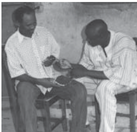
El método atrae a los hombres en Benin.